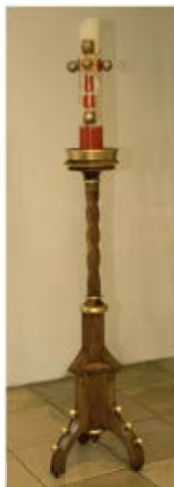
2010 renovierter Osterleuchter