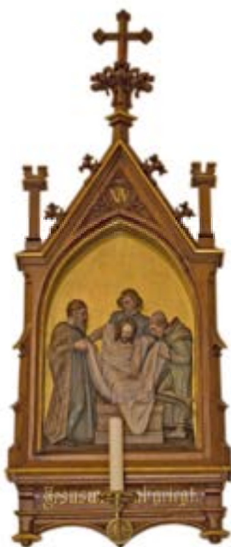
Kreuzwegbild 14. Station: Jesus wird in das Grab gelegt