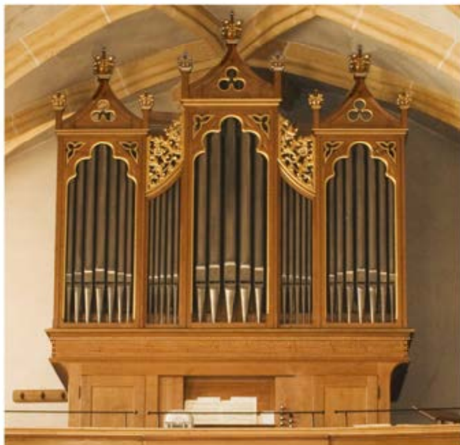
Schleifladenorgel - gefertigt 2001 - 15 Register und 2 Manuale

Des Weiteren gehören zur Pfarrkirche vier Kirchenfahnen und zwei Prozessionslaternen, die um die Jahrhundertwende zum zwanzigsten Jahrhundert entstanden sind. Historisch nennenswerte Paramente sind keine vorhanden. Der Grabheiland entstammt dem in den Herz-Jesu-Altar von 1900 integrierten „Heiligen Grab“, der rechts des Triumphbogens stand. Heute gibt es keinen „Heilig Grab“-Aufbau mehr, der Grabheiland wird am