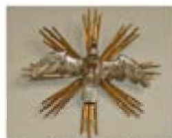
Hl. Geist Darstellung

Weitere Figuren der Kirche sind: Im Chorraum an der Süd-