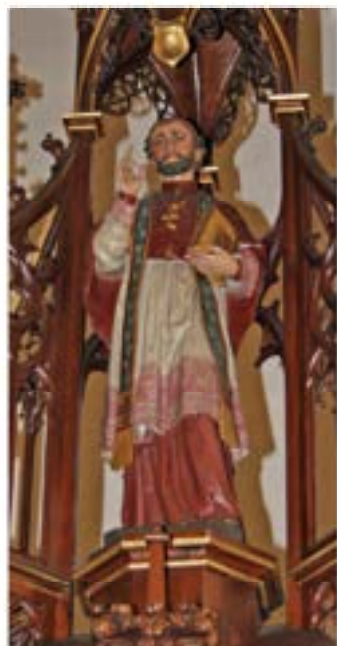
Hl. Abt Leo von La Cava

der Hl. Bartholomäus, flankiert von den heiligen Märtyrerinnen Barbara und Katharina von Alexandrien.