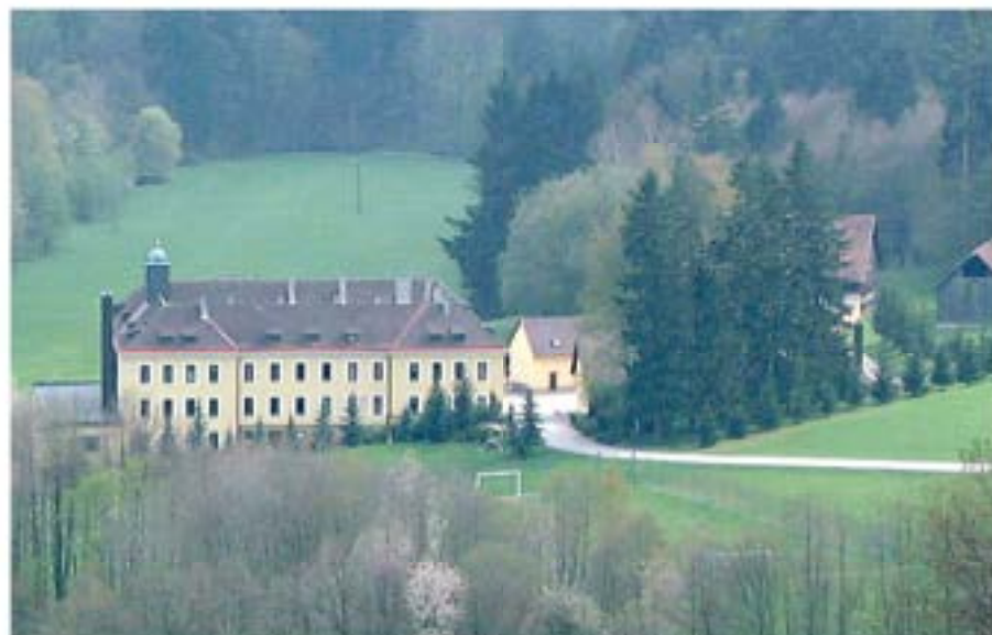
Edelfhof, Prünst 12, Nordansicht 2002

Der in der Prünst gelegene Edelfhof geht auf ein im 14. Jahrhundert entstandenes einfaches Gut zurück. 1927 kauften es