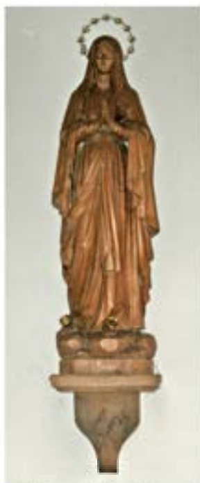
Unsere liebe Frau von Lourdes