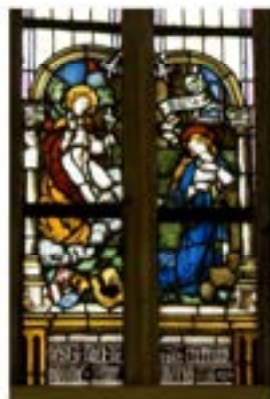
Nordfenster im Chorraum

einen gemauerten Sonnenuhr-Turmreiter. Dieser wurde beim zweiten Türkeneinfall 1683 mitsamt dem Dach zerstört und erst 1836 durch einen rechteckigen Turm in der jetzt bestehenden Form ersetzt. In der langen Zwischenzeit trug die Kirche über dem Chorraum einen Dachreiter mit Zwiebelhelm. Das 1945 zerstörte Turmdach wurde vier Jahre später durch einen um zwei Meter erhöhten Spitzhelm ersetzt. Im Turm hängen 4 Glocken, die Totenglocke mitgezählt.