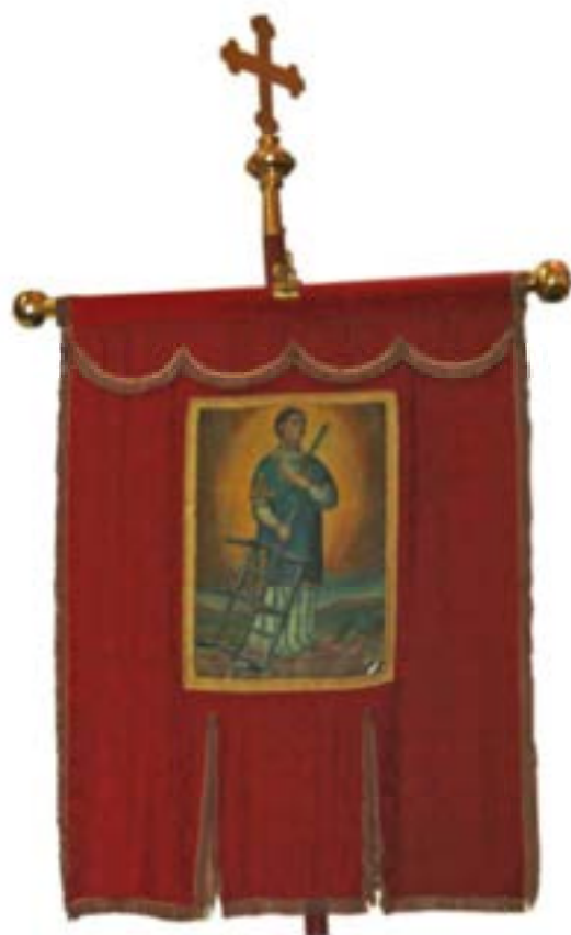
Eine der vier Kirchenfahnen - darstellend den Hl. Laurentius

Für die kostbare Reliquie des Heiligen Kreuzes Christi, die seit 2006 in einer neu gefertigten Kreuzmonstranz gefasst ist, sei auf die Schrift „Das Kreuz des Herrn“ verwiesen. Ansonsten besitzt die Pfarrkirche eine Knochenreliquie des Hl. Pfarrpatrons Bartholomäus und einen neubarocken „Wettersegen“.