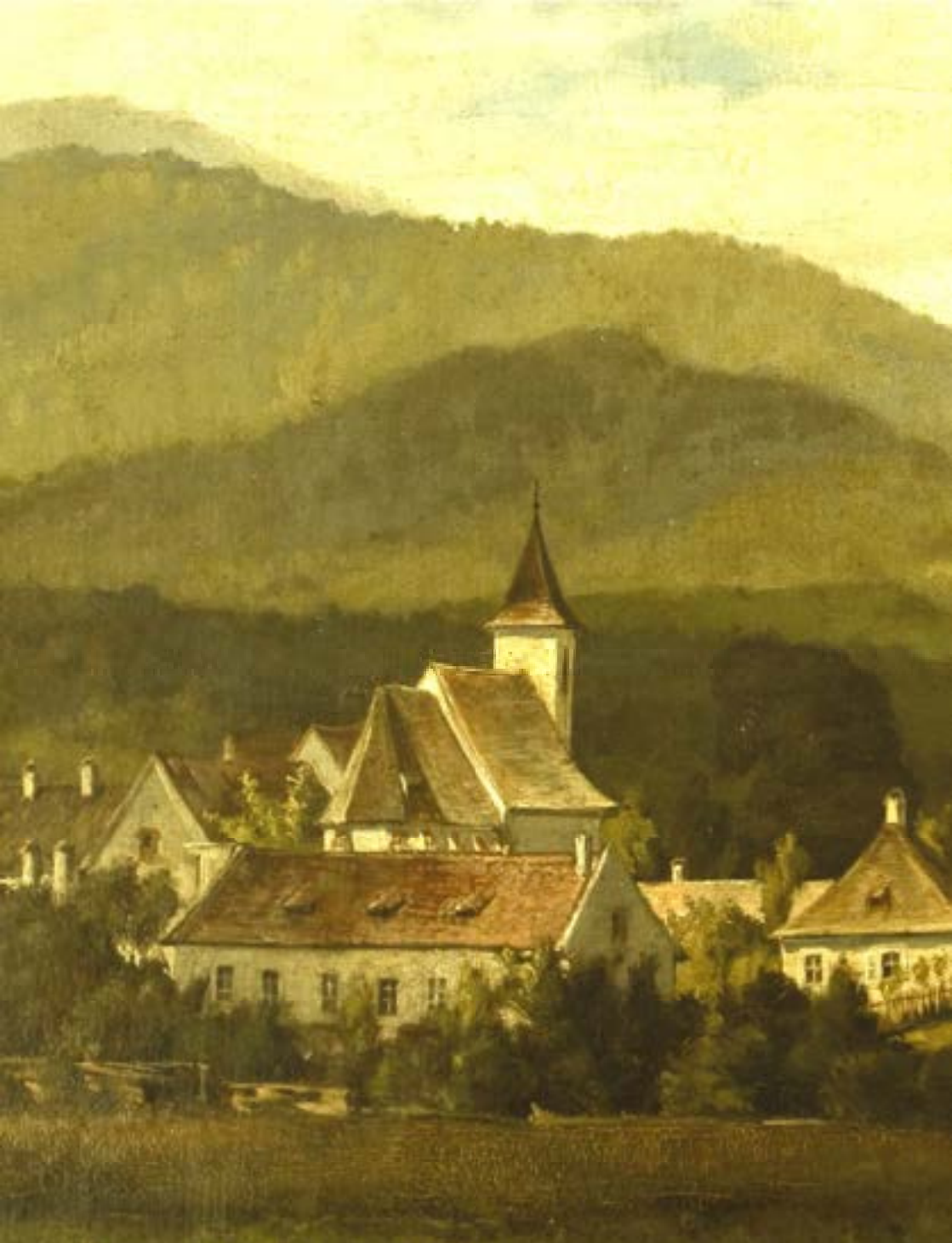
Aquarell - Rohrbach um 1890