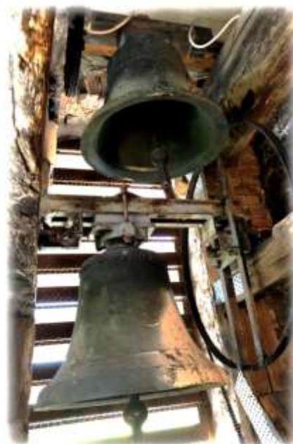
Glocke II und III