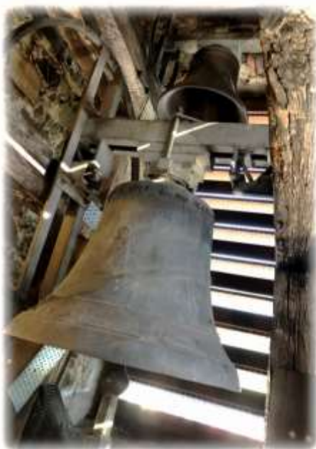
Glocke I und IV

Fotos zur Glockenweihe 1923, 1947 und andere pfarrliche Ereignisse sind in der Topothek Rohrbach anzusehen, unter folgenden Link: https://rohrbach-goelsen.topothek.at